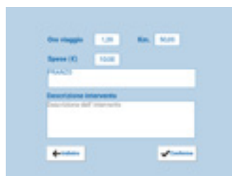
DATI GENERALI Inserimento dati generali dell'intervento, spese di viaggio, km e descrizione.