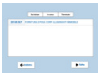
COMMESSE Gestione delle commesse relative al cliente selezionato.