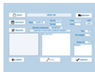
RIEPILOGO RAPPORTINO Riepilogo del rapportino da cui è possibile controllare i dati inseriti.