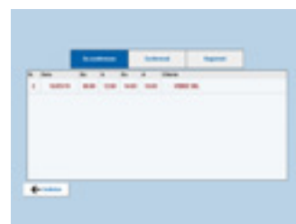
ELENCO RAPPORTINI In questa sezione visualizzeremo tutti i rapportini inseriti. Potranno essere modificati solo quelli non confermati e non registrati.