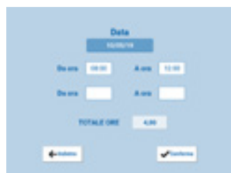
ORARI Inserimento data e ora dell'intervento.