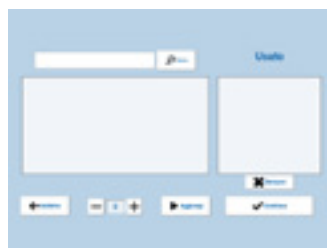
MATERIALE Da questa finestra è possibile selezionare il materiale utilizzato per svolgere il lavoro.