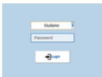
LOGIN La prima schermata dell'app prevede il login.