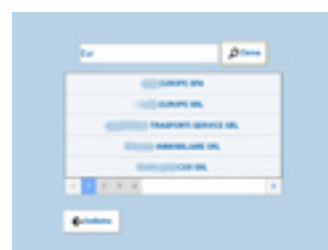
NUOVO RAPPORTINO L'inserimento del nuovo rapportino inizia selezionando il cliente.