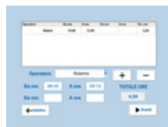
OPERATORI AGGIUNTIVI Selezione degli operatori aggiuntivi oltre a quello che sta inserendo il rapportino.