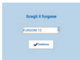
SELEZIONE DEL FURGONE Schermata dell'app dedicata alla selezione del furgone.