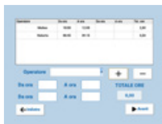
OPERATORI AGGIUNTIVI Completamento di tutti gli operatori.